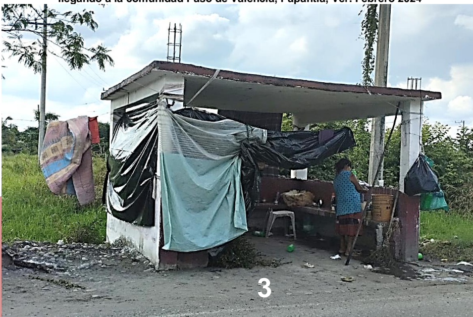
CUARTA TRANSFORMACIÓN: Parada de autobus transformada en vivienda, llegando a la comunidad Paso de Valencia, Papantla, Ver. Febrero 2024

En el país desaparecen al día 17 menores de edad en promedio. ▀ Jornada