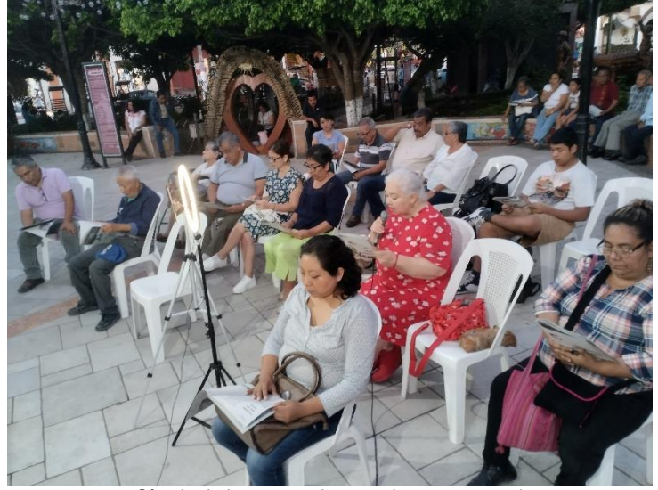
Círculo de lectura tumista en el parque central

El Túmin no nació como un objetivo turístico, sino para facilitar el comercio local. Sin embargo, ha provocado cierto turismo, principalmente entre estudiantes e investigadores académicos que vienen a la región a conocer esta moneda comunitaria, como materia de estudio o de trabajo. ▲